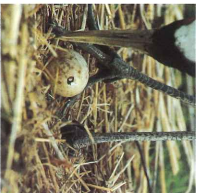
조금만 있으면 탄생 (아기 두루미의 부리가 보인다)