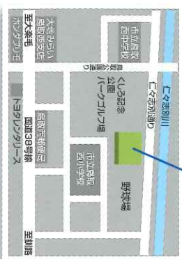
鳥取ドーム 釧路市コミュニティ体育館