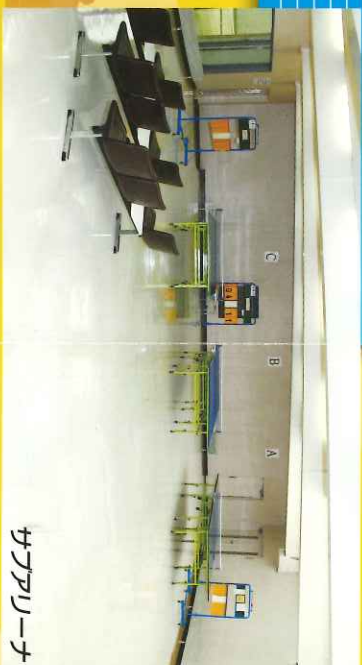
サングラフコート

サングラフコートは各種展示会に、研修室は会議など、文化系サークルやイベントなど、幅広くご利用いただけます。