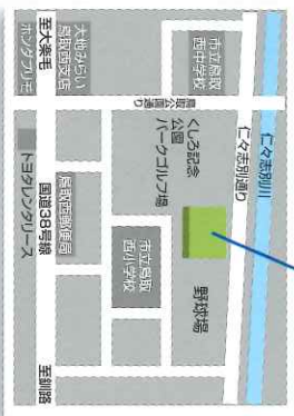
鳥取ドーム 釧路市コミュニティ体育館