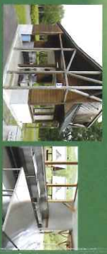
●炊事棟 料理するのが楽しくなるような広々とした開放的な炊事棟。