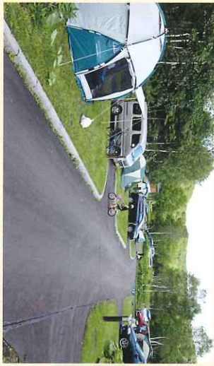
●キャンピングカーサイト 整備された駐車スペース、ゆったりとゆたわりのキャンピングカーサイトです。 電源、水道口、汚物タンク完備の10サイト。駐車スペース1サイトにつき1台となっています。