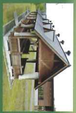
●パーベキューハウス 雨天の時や夜も照明がありますので、焼肉などが楽しめます。カーン付きなので多少風が吹いてもご利用できます。48名まで