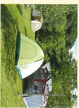
●グリーンサイト 専用駐車場へ1サイト1台駐車できます (サイトに備付けではありません)。自由にテントスペースを確保してお楽しみください。