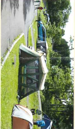
●スタンドサイト 白樺の木に囲まれたサイトで、1サイトごとのプライベート空間になっているのがたまらない。 電源付き (30アンペア) 駐車スペースは1サイトにつき1台となっています。