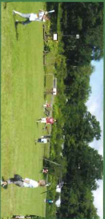
●センターハウス広場 シャワー、バドミントン、バレーなどができる、おちよとした小運動場、遊具もあり子供たちが楽しめる広場です。