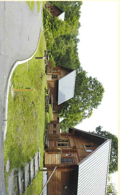
●施設の整ったコテージ (10棟) コテージに備付パーベキュー炉、焼肉で缶ビール! 食が進みます。