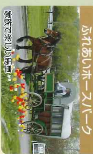
ふれあいホースパーク

シマフクロウ、タンチョウ等、北海道の希少な動物を数多く展示しています。☎0154(56)2121