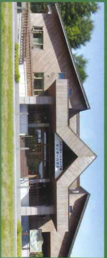
●センターハウス 広い空間は、受付、売店、シャワー室、コインランドリー、障害者用シャワー室とトイレを完備。観光案内の発信基地!